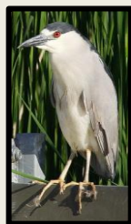
Martinete común ( Nycticorax nycticorax )

Desde aquí además comienza un tramo embalsado (Embalse de San José), con abundante vegetación palustre y niveles constantes de agua, que da lugar a un hábitat apropiado para muchas aves. Las aves acuáticas utilizan este hábitat para reproducirse, invernar o descansar durante migraciones y entre ellas se puede divisar: aguilucho lagunero, garza imperial, martinete, milano real o águila calzada.