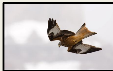
Milano real ( Milvus milvus )

La ruta también avanza por otro tipo de paisajes, una extensa llanura en la que predominan los cultivos de cereal de secano, e los que se intercalan parcelas de regadío pinares-isla de pino piñonero y resinero, algunos montes de encina y lagunas de pequeño y mediano tamaño.