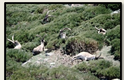
Cabra Montesa ( Capra pyrenaica hispanica )

Los roquedos en la Sierra de Hoyo de Manzanares y el macizo granítico de « La Pedriza » de Manzanares, son considerados, geomorfológicamente, un ejemplo modélico.