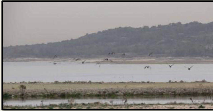
Embalse de Santillana

Con el objetivo de conservar la riqueza y variabilidad natural de este entorno, se han declarado varias figuras de protección del territorio y áreas prioritarias de conservación, como la del Parque Regional de la Cuenca Alta del Manzanares , en que se integran además las figuras de Embalse Protegido , Montes de Utilidad , las pertenecientes a la Red Natura 2000 , Reserva de la Biosfera , y más recientemente la de Parque Nacional de la Sierra de Guadarrama . Dentro de los espacios de la Red Natura 2000 se incluye la Zona de Especial Importancia para las Aves (ZEPA) Monte del Pardo, gestionado por Patrimonio Nacional, ya que la preservación de sus masas boscosas hasta nuestros días ha sido debida al interés que tuvo la monarquía en disfrutar de las cacerías.