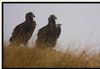
Buitre negro ( Aegypius monachus )

Entre las especies de mamíferos, es interesante la Cabra Montesa , por ser una especie recientemente reintroducida dentro del Parque.